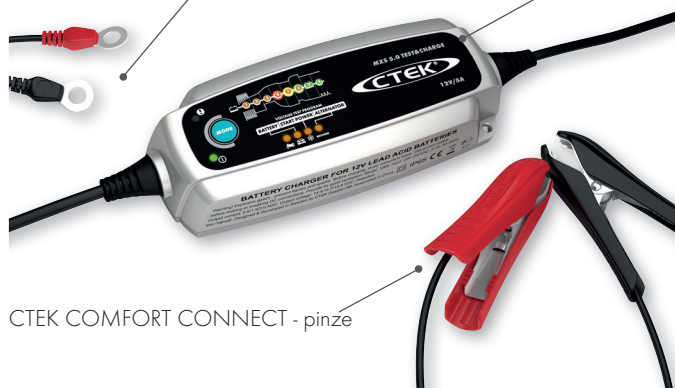
CTEK COMFORT CONNECT - pinze